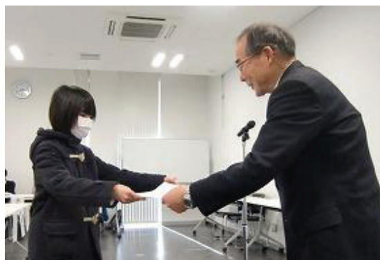
コンクール受賞者の表彰