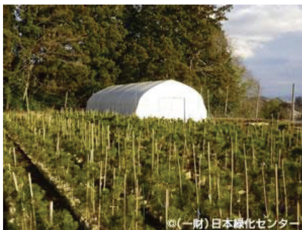
ビニールハウスの外観