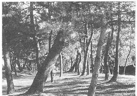
長崎街道「曲里の松並木」

旧街道緑地「曲里の松並木」は約1キロ（300m未整備）には約600本の松林が緑陰をつくる。ひとときわそびえるのが樹齢200～300年といわれる老松4本である。街道の両側に小高い土堤が築かれそこに植栽されている松林、樹齢はさまざまだが江戸時代の面影をよく伝えている街道である。松並木の両側は住宅群、三菱化成の社宅の跡地には