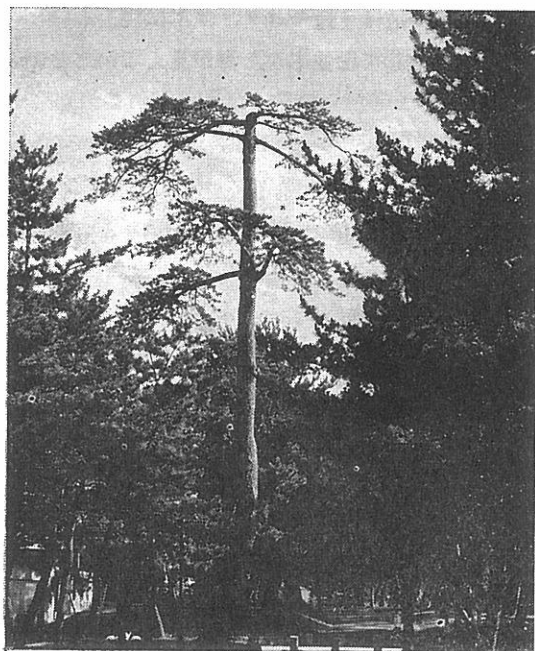
樹木医が樹勢回復をはかった老松

旧街道緑地の松並木には, 胸高直径30cm以上の松が167本ある。これらの松林が長崎街道の主景をなしているものだ。ちなみに30~40cmの松は