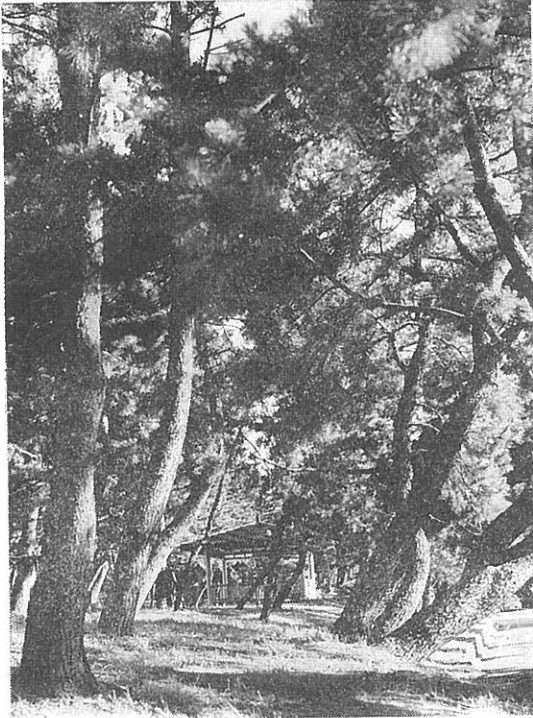
よみがえった曲里の松並木

江戸時代そのままに道幅約4m、両側にそれぞれ約10mの土堤が築かれ、20年生前後の松林がつづく。黒崎側の人口は城塞を思わせる大石で築かれ、鉄平石の排水溝と敷石、松並木の林床はきれいに刈り込まれていた。根締めにはササ類をはじ