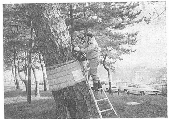
樹幹注入剤グリーンガードで守る