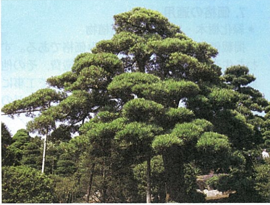
▲①アカマツ ②H3.8m, 目通り1.28m, W5.0m ③蓬菜作り ④250年 ⑤神奈川県