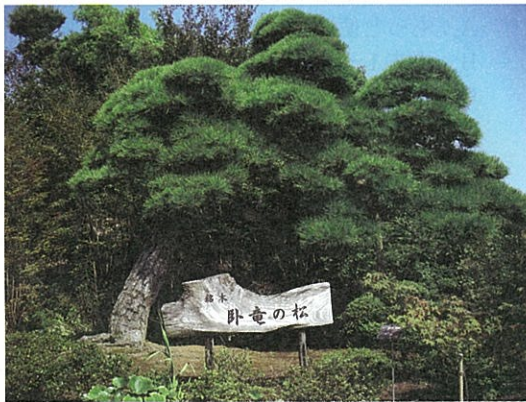
◀①クロマツ ②H4.5m, 目通り1.1m, W6.0m ③曲幹作り ④250年 ⑤神奈川県