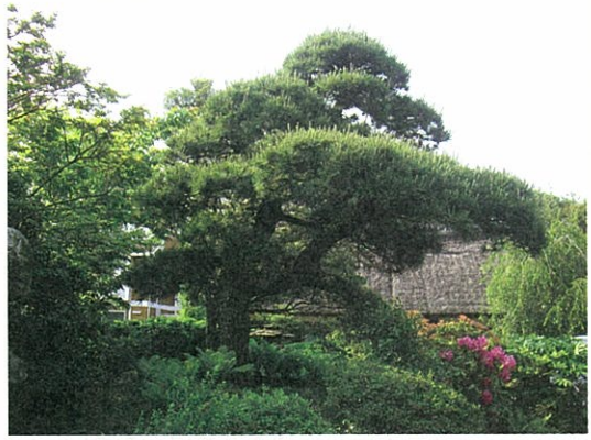
▲①クロマツ ②H5.5m, 芝付き1.5m, W5.3m ③横流枝 ④200年 ⑤千葉県