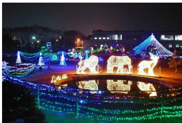
イルミネーション