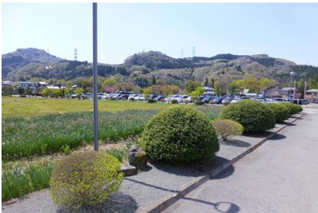
花壇 (左：ツゲ・ツツジ、右：クロマツ)