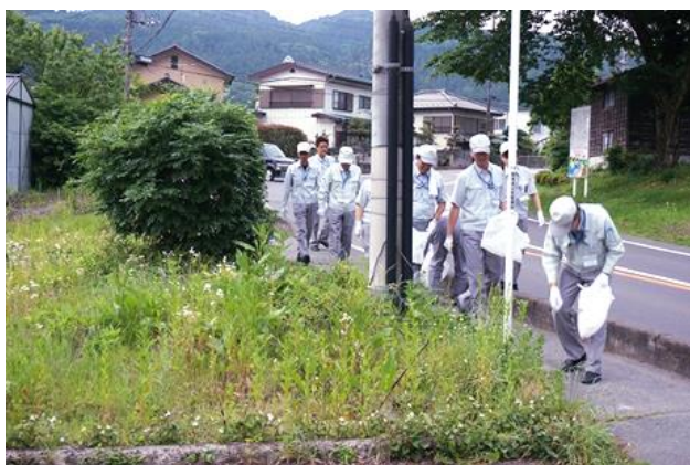
会社周辺のゴミ拾い