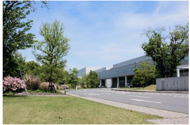
景観を重視した構内道路