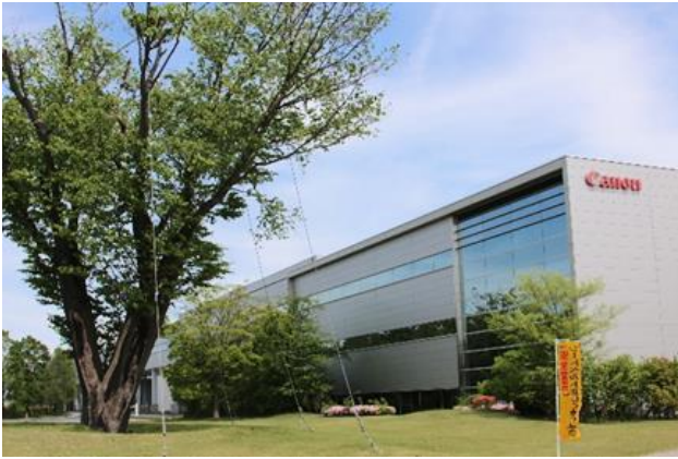
ランドマークとロゴの共存