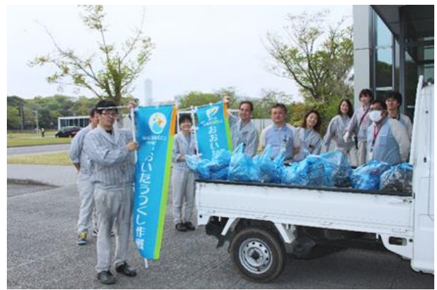
みんなで楽しく清掃活動