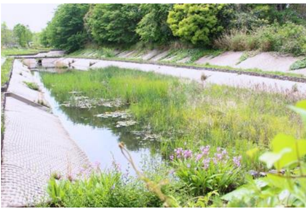
カエルの鳴き声が心地よいビオトープ