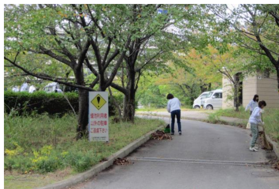
地域周辺の啓蒙活動