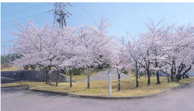
工場完成記念植樹