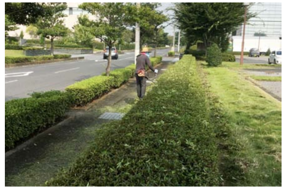
社員による草刈り・芝刈りの様子

各作業は暑かったり、疲れたり大変ですが、終わった後の爽快感は格別なものがあります。