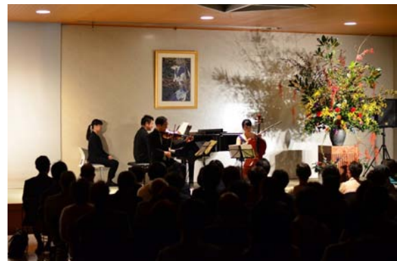
ふれあいコンサートの様子

当社は「ふれあいコンサート」を毎年10月に行っています。今年で25回目を数え、近隣のみなさんや自治体・取引先関係者、社員の家族や友人を招き、集めたタオルや石鹸を町の福祉施設に寄付する活動を続けています。