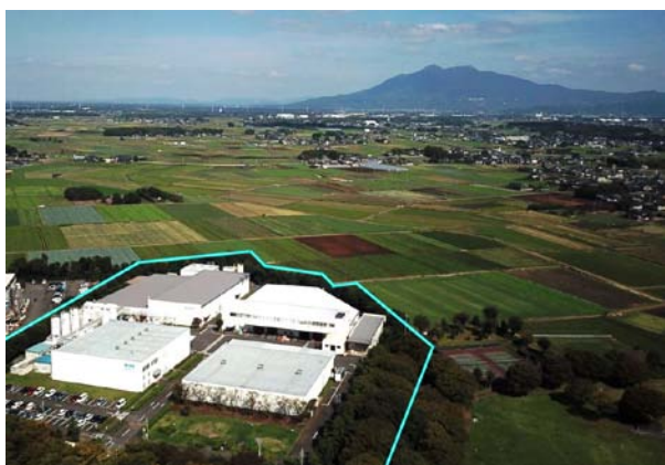
①工場全景(筑波山を望む)