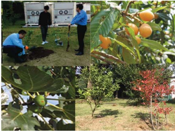
⑤園芸班 果樹園 (ゆず、ピワ、いちじく、きんかん、ブルーベリー等)