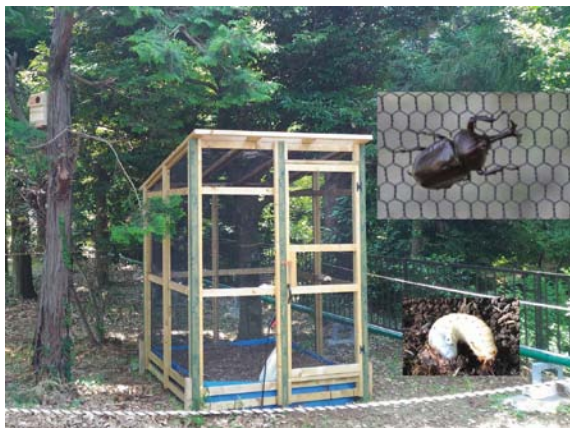
ビオトープから発生したカブトムシを近隣の児童館に配布、また納涼祭にて配布を行うなど環境啓発活動を通じて地域交流を図っている。