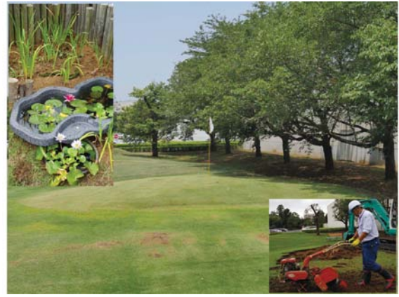
⑥体育班 ゴルフ練習場、ビオトープ池