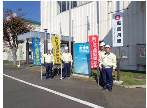
挨拶運動を継続的に実施し、コミュニケーション意識の向上を図っている。