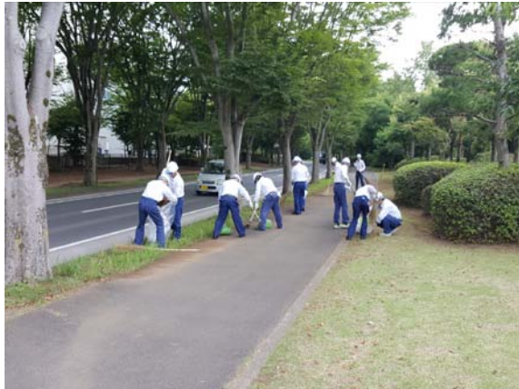
5S委員会を設置し、構内及び敷地外周の清掃、落ち葉拾い等を継続的に実施している。