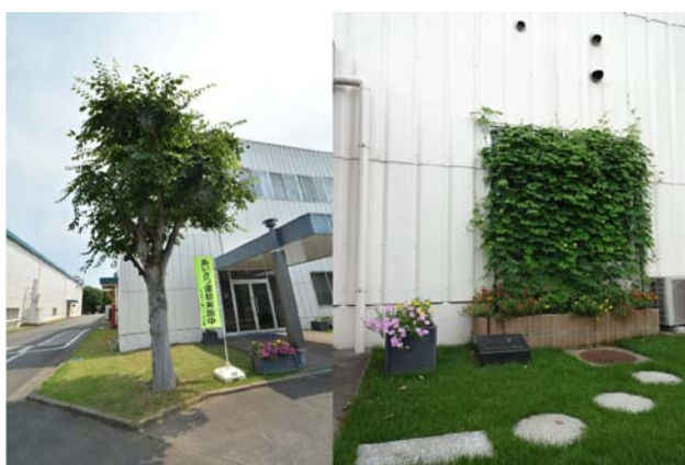
③事務所玄関前けやき(つくば市シンボル木)、 グリーンカーテン