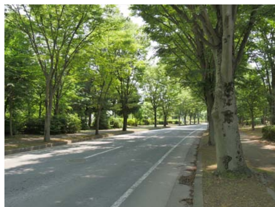
②工場玄関前つくばテクノパーク豊里の街路樹