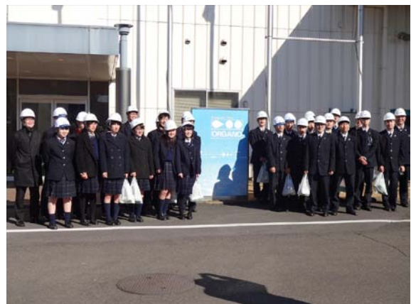
県内高校生の工場見学、教育を受け入れている。