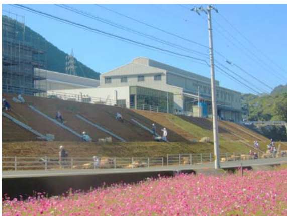
シバザクラの植樹風景