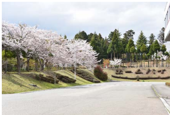
サクラとツツジのホームパイ