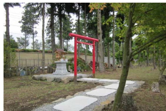
井戸の神様を祀る「不二水神社」

ミルクやホームパイの原料仕込水には、この井戸から汲み上げた富士山の天然水を使用している