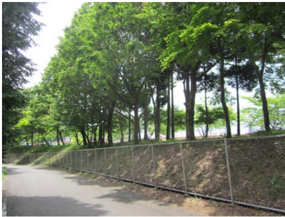
工場外周から見た緑地