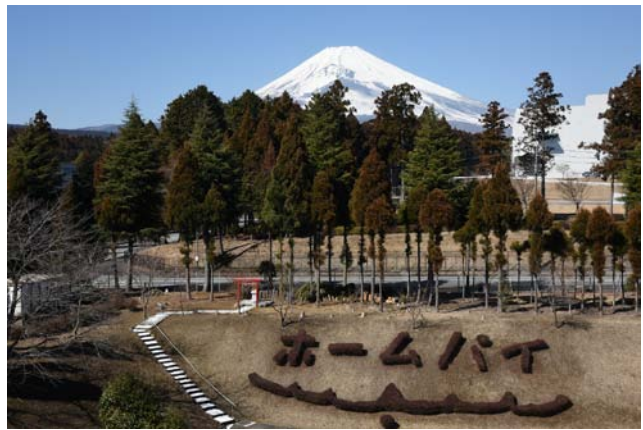
工場からは雄大な富士山が見える