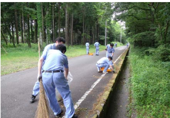
事業所周囲の公道清掃と不法投棄物処分