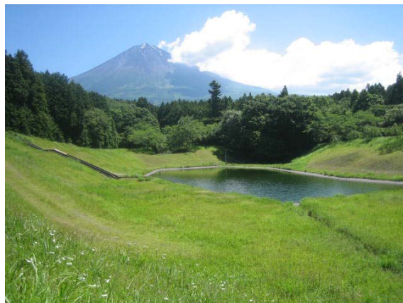
緑に囲まれた渡り鳥の休息池(敷地内調整池)