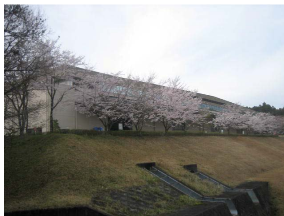
工場周囲のサクラ並木