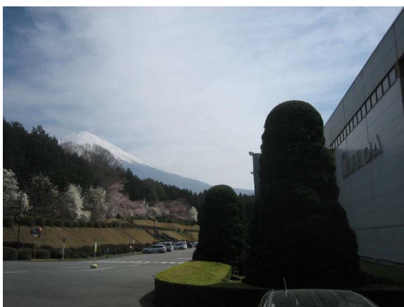
初春の森と法面(サクラとツツジ・サツキ)