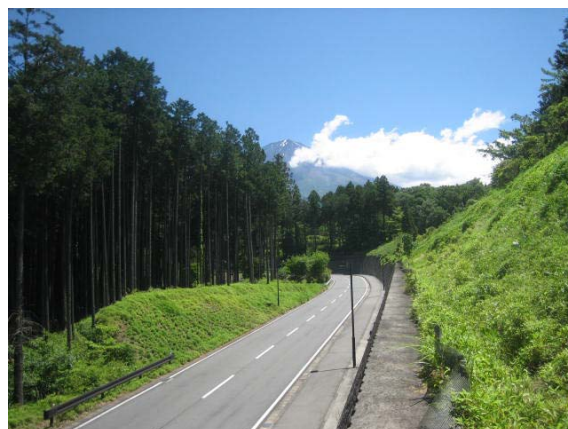
アマダの森(間伐・枝打ち)、法面のコグマザサ