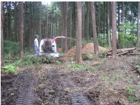
森の間伐の枝をチップにして再利用

○従業員による事業所外周の清掃活動や朝霧高原にある田貫湖を従業員とその家族がウォーキングしながら清掃活動を実施している