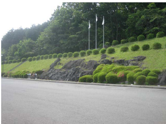
法面の自然岩と植栽