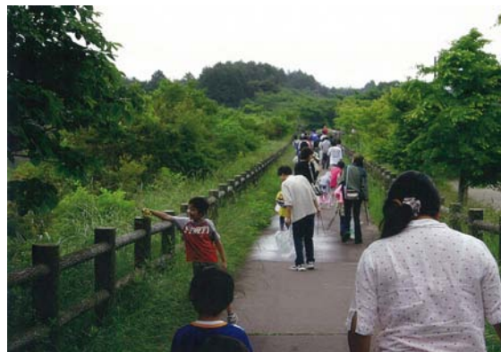
従業員・家族で田貫湖清掃