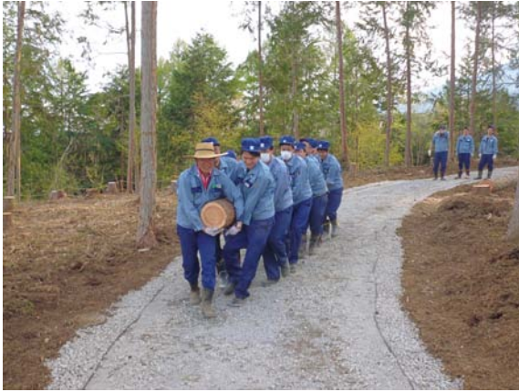
社員による遊歩道整備(2014年)