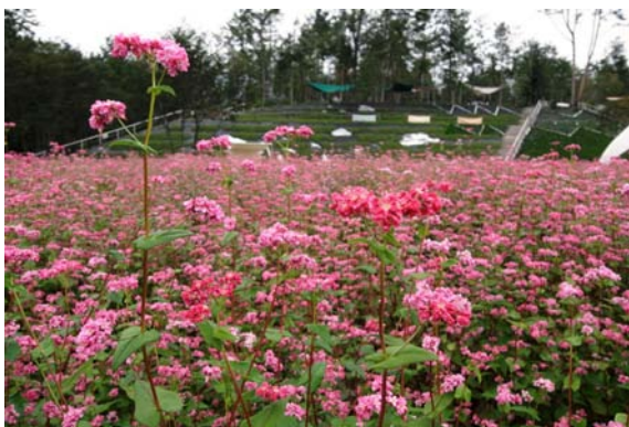
咲き誇る赤そば(高嶺ルビー)