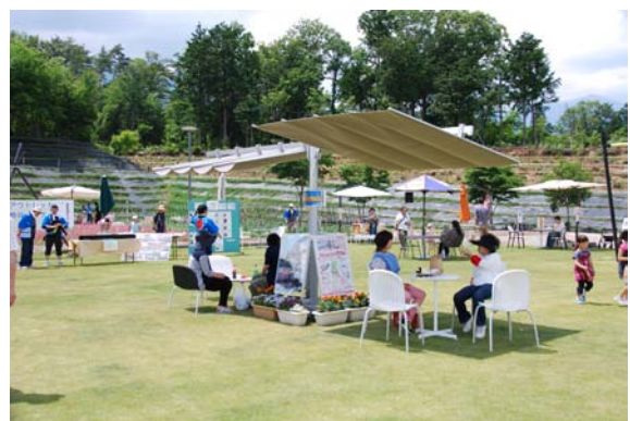
第1回 赤そば祭り(2016年6月)