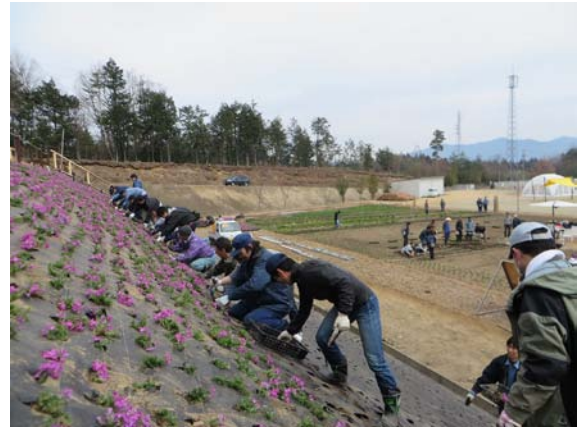
社員による植栽活動(2015年)