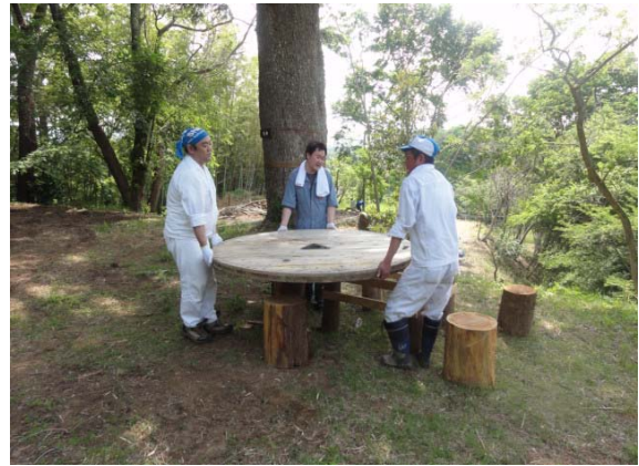
テーブル・イス設置