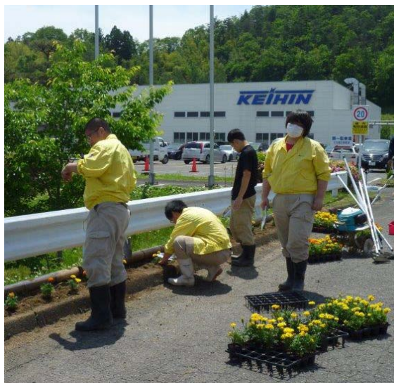
地元高校生による植栽