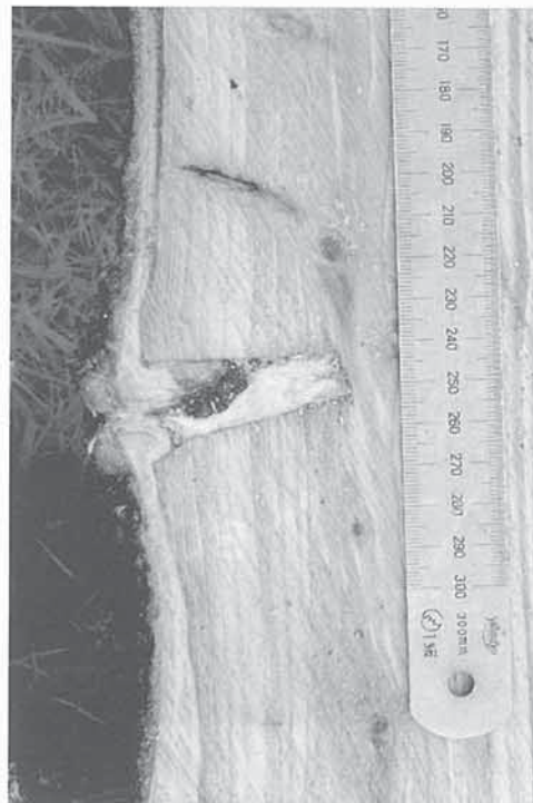
写真2 新鮮な傷のウレタン充填(ウラジロモミ)

樹勢の衰弱は外科手術では直接は防げないことが多く、樹勢回復には環境を整えることが重要とされる。従来の外科手術もきちんとすれば傷口の癒合の促進には有効であるが、完全に癒合するのにどれほど時間がかかるかは対象樹木の大きさ、樹齢、樹勢や傷の大きさによって左右される。ところが、実際にはいつまでたっても巻き込みそうにない、意図が不明な手術もよく見られる。外科治療を要する樹木の多くは樹齢が高いとか、周辺の環境が悪いとかの理由で樹勢が低下していることが多いので、傷口や内部の腐朽をどのようにもっていきたいのかを明確にして処置すべきである。